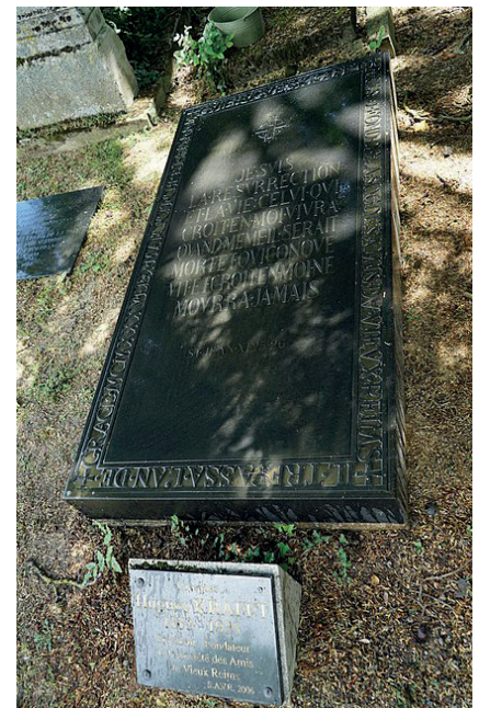
La tombe de Hugues Krafft et la plaque de la S.A.V.R. dans le canton 25 du cimetière du nord à Reims.