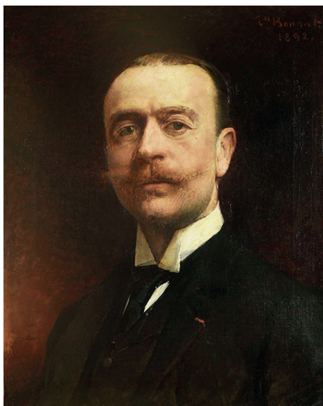
Hugues Krafft par Léon Bonnat, 1892. Collection Musée Le Vergeur.